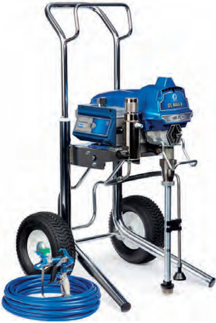
Ultra Max II 695